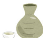
日本酒(1 5%) 180ml