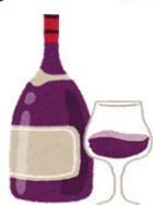
ワイン (12%) 200ml