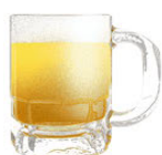
ビール (5%) 500ml