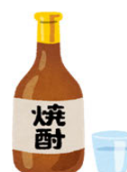
焼酎 (25%) 100ml